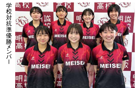
学校対抗準優勝メンバー