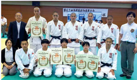
総体に参加した柔道部員たち