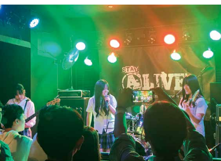
ステージ発表する軽音楽部員たち

軽音楽部が6月30日、ライブハウスALIVEにて開催された「紅・歌会始」に参加し、ステージ発表を披露した。曲目は、①拝啓、少年よ②チェリー③Oasia④ないものねだり⑤ジャージ」だった。6月2度目のステージ発表で、部員たちにとっても貴重な経験を積むことができる場となった。年々ステージ依頼をいただく件数が増えてきており、今後の活躍も期待している。